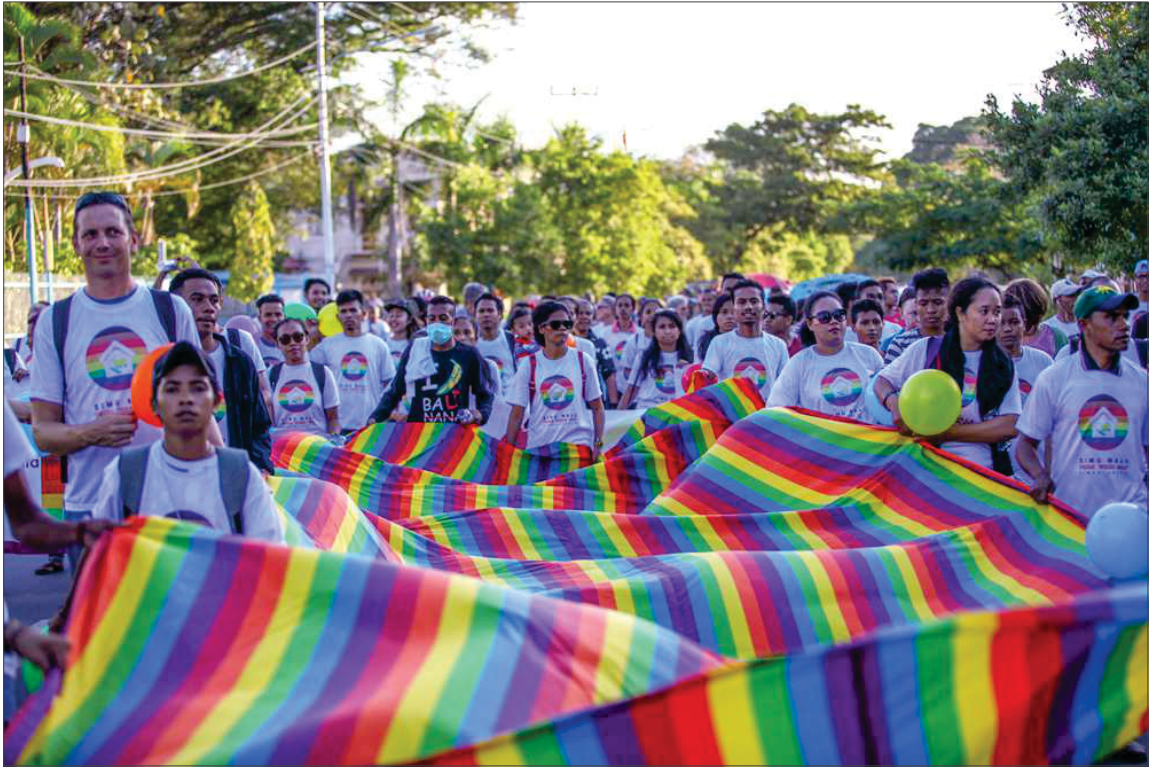
During 2017 Timor Leste Pride March